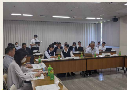
第一回総合計画審議会