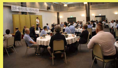
総会の懇親会には国会議員や館山・南房総市長、県議、漁業、観光関係者などが全国から参加

館山の魅力は海山の資源、そして癒しの力にあると思います。財政が厳しい今だからこそ、守りと攻めの戦略を構築するよう提言していきます。