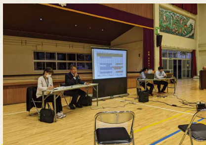
北条小での説明会